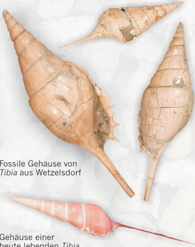
Fossile Gehäuse von Tibia aus Wetzelsdorf

Sie ist durch ihre Form mit dem extrem verlängerten "Schnabel" und die Stacheln an der Mündung, die ein Einsinken verhindern, an ein Leben auf dem weichen, schlammigen Meeresboden angepaßt.